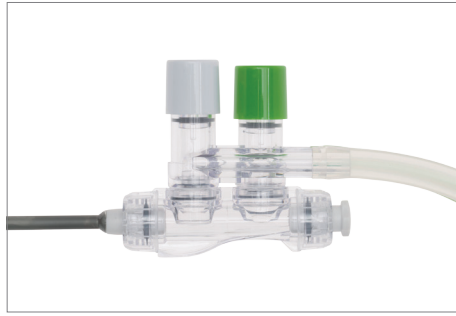
Zuig- en irrigatiesysteem – handgreep