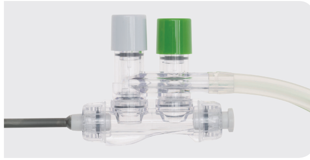
Sug og spyl - håndstykke.