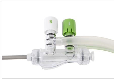
Suge- og skyllesæt, håndstykke