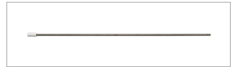
Suge- og skyllesæt, rør