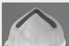
Formbar skumstrimmel dækker næseklemmen

FFP3 filtrerende halvmaske er designet til at beskytte sundhedspersonale og patienter fra overførsel af mikroorganismer.