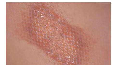
Fase de epitelización