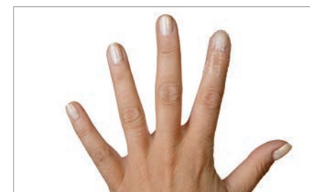
Mepitel One en un dedo