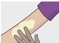
Tepti ant odos

Prausimas, ypač su prausikliais, kurių sudėtyje yra neigiamą poveikį odai turinčių medžiagų, gali dar labiau sausinti odą. NICE rekomenduoja naudoti emolientus prausimuisi ir maudymuisi 3 kiekvieną dieną.